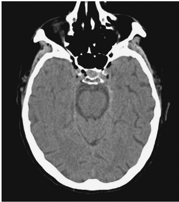
Fig. 2 Colecciones aéreas a nivel de ambos senos cavernosos.

han demostrado que un embolismo aéreo a través de un catéter venoso estándar tiene altas posibilidades de ascender vía retrógrada por la circulación venosa, dependiendo del tamaño de las burbujas, del diámetro del catéter y de la fracción de eyección 9,10 . La isquemia por émbolos aéreos se produce por varios mecanismos: obstrucción del flujo sanguíneo, vasoespasmo y formación de trombos por activación plaquetaria. La relación temporal entre el ictus y el procedimiento facilita la sospecha para el diagnóstico. Las