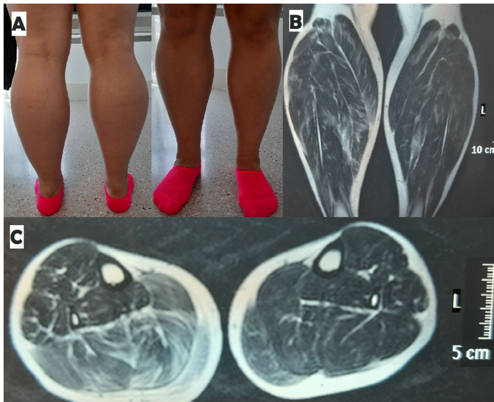
Figura 1 Visión posterior y anterior de las piernas de la paciente (A). Resonancia magnética de piernas T2 coronal (B) y axial (C), en la que se observa hipertrofia bilateral de tríceps sural de predominio derecho con aumento de señal en gastrocnemio derecho.

Mujer de 35 años que sufrió en 2016 un síndrome de cola de caballo secundario a una hernia discal L4-L5 con compresión de raíces L4, L5 y S1 de manera bilateral, por el que fue intervenida de urgencia. Tras un período inicial en el que se produjo una atrofia muscular de ambos gemelos, la paciente recuperó progresivamente la masa muscular de ambas piernas, aunque notando siempre una mayor atrofia muscular residual en la derecha. Aproximadamente un año después, comenzó a percibir un aumento progresivo del volumen de ambas pantorrillas con dolor en ambos gemelos, motivo por el que consulta. A la exploración destacaba una hipertrofia gemelar bilateral de predominio derecho (fig. 1), con importante tensión a la palpación, debilidad para la flexión de los dedos del pie derecho, contractura muscular dolorosa en pantorrilla derecha a la flexión plantar del pie derecho e imposibilidad para la marcha de puntillas. La fuerza por grupos musculares era por lo demás normal, V/V en la escala MRC. Los reflejos aquileos estaban abolidos de forma bilateral, siendo el resto de reflejos osteotendinosos normales (3/5 simétricos). En el análisis de sangre destacaba una CPK 514U/L, con