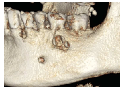
Figura 4. Tomografía volumétrica dental: SSD (reconstrucción de sombreado de superficie).

Correspondencia: D. Schulze. Dentales Diagnostikzentrum Breisgau. Kaiser-Joseph-Straße 263, 79098 Friburgo, Alemania. Correo electrónico: dirk.schulze@ddz-breisgau.de