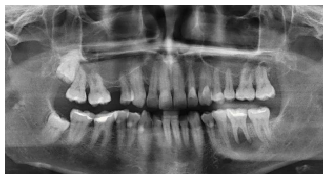
Figura 1. Ortopantomografía.

Debido a las dimensiones del proceso y a la presencia de perforación del hueso compacto bucal, además de un quiste se sospechó como diagnóstico diferencial la presencia de un granuloma eosinófilo. En la preparación histológica de la muestra obtenida por resección pudo confirmarse un quiste radicular.