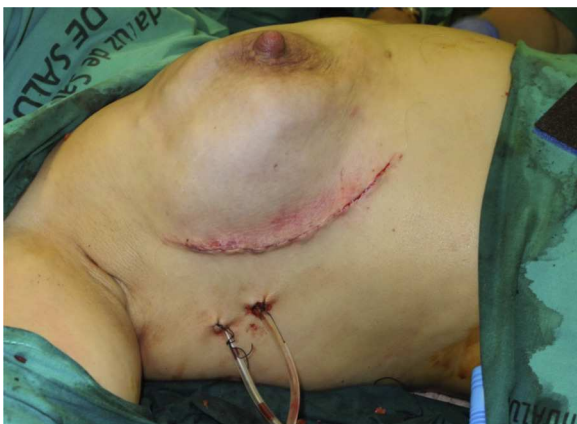
Figura 2 Resultado postoperatorio inmediato.

En las reconstrucciones tras mastectomía, el tratamiento neoadyuvante y adyuvante, sobre todo después de la radioterapia, aumenta el número de complicaciones y la pérdida de implantes. Así, Krueger et al. 17 observan un 68% de complicaciones en las paciente irradiadas frente al 31% de las pacientes no irradiadas, con un porcentaje mayor de pérdidas de implante. Cordeiro y McCarthy 18 también presentan un número mayor de complicaciones absolutas en las pacientes irradiadas frente a las no irradiadas (11,7 vs. a 5,6%), con un porcentaje mayor de infecciones, pérdida de implante,