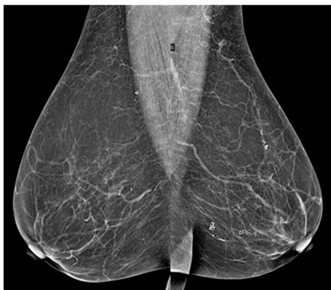
Figura 1 Mamografía bilateral. Proyecciones oblicuas.

Mujer de 54 años, inmigrante, procedente de Guinea ecuatorial, residente en España 8 meses y sin otros antecedentes de interés, tampoco presentaba antecedentes de cirugía mamaria. Es derivada a consultas externas de la unidad de mama por mastalgia no cíclica. En la exploración mamaria no se evidenciaban alteraciones cutáneas ni lesiones palpables. Se solicitó una ecografía mamaria en la que no se detectaron nódulos sólidos, ni quísticos, ni adenopatías axilares. Se completó el estudio con una mamografía bilateral que describía calcificaciones serpiginosas alargadas en ambas mamas (figs. 1 y 2). La forma de las calcificaciones, su distribución en grupos formando como ovillos y la ausencia de otras distorsiones en la arquitectura u otras alteraciones se asigna a la categoría BI-RADS® 2 y se relaciona con patología benigna. De hecho, son calcificaciones que no se relacionan con los ductos, ni presentan pleomorfismo o irregularidad distinguiéndose de calcificaciones malignas (fig. 3). Dados los antecedentes de la paciente y las características típicas en la mamografía, calcificaciones serpiginosas bilaterales, los hallazgos eran sugestivos de filiarisis. Se realizaron 2 analíticas sanguíneas que descartaron la presencia de