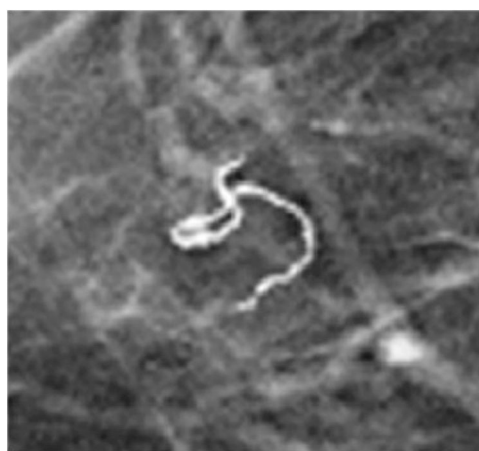
Figura 3 Filaria calcificada en el tejido mamario.

microfilaris en sangre. Por tanto, ante una filiarisis en fase de enfermedad inactiva, la paciente no precisó de tratamiento médico específico ni quirúrgico.