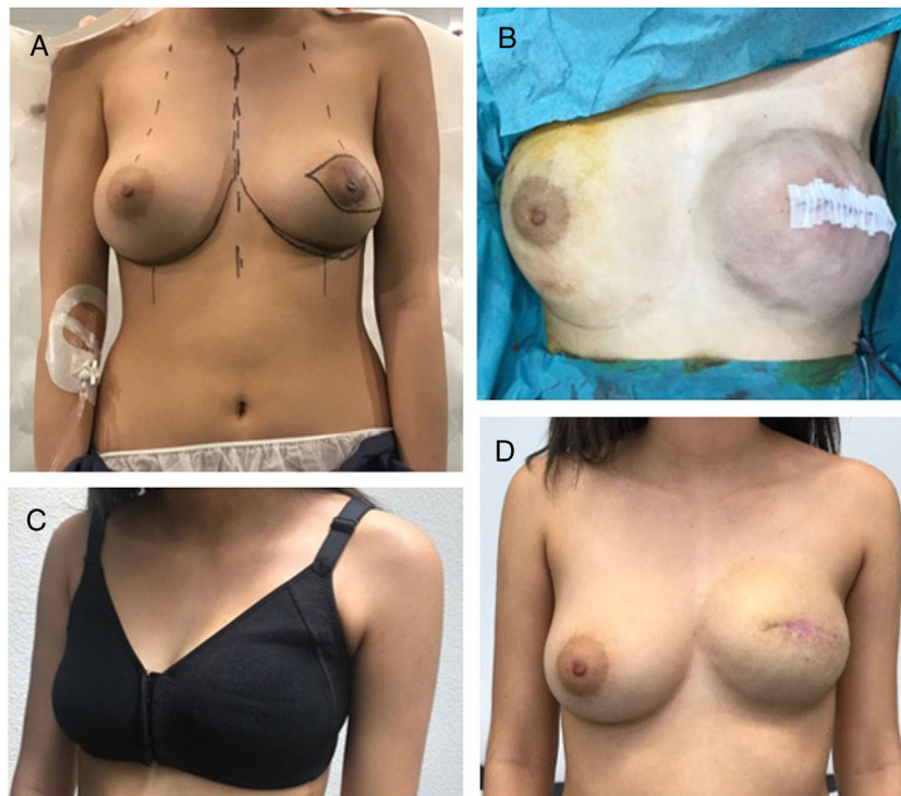
Figura 2 A) Planificación quirúrgica previa a mastectomía izquierda con reconstrucción inmediata. B) Resultado inmediato de mastectomía izquierda. C y D) Resultado al mes de la cirugía.