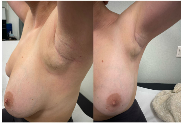
Figura 1 Aspecto de la masa axilar por la que la paciente consulta inicialmente. A) Vista lateral. B) Vista anteroposterior.

observando en su interior una lesión hipercaptante con márgenes espiculados de 2,4 x 1,2 cm (fig. 2A), con ganglios linfáticos axilares inespecíficos a niveles I, II y III de Berg. El resto de tejido mamario y axilar sin alteraciones sugestivas de malignidad.