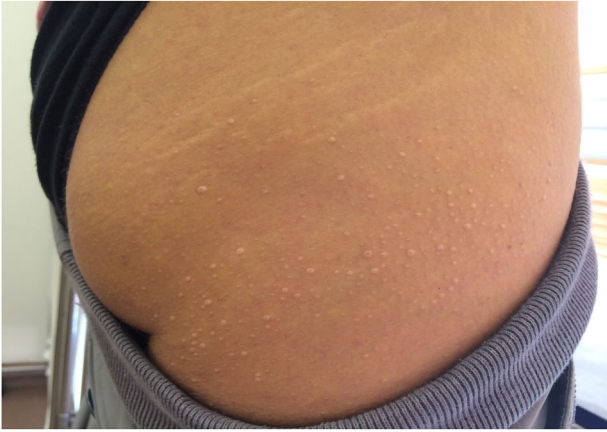
Figura 3 Xantomas eruptivos en una paciente con síndrome de quilomiconemia.

patognomónicos) de quilomiconemia familiar (QMF), suelen presentarse como pápulas amarillentas de 1 a 4 mm de diámetro rodeadas de un halo eritematoso, distribuidas más frecuentemente en glúteos y superficies extensoras de miembros (codos y rodillas) 9 . A veces, pueden coalescer en placas de mayor tamaño que se denominan xantomas tuberoeruptivos. En la exploración física, debemos de descartar la presencia de bocio, depósitos lipídicos extravasculares y visceromegalias. La hepatomegalia es relativamente frecuente en la esteatosis hepática que acompaña a muchas condiciones clínicas que cursan con hipertrigliceridemia, pero la esplenomegalia debe orientarnos a la presencia de QMF. Cuando sea posible, valoraremos el fondo de ojo para descartar lipemia retinalis , poco prevalente y en general relacionada con niveles sostenidos de triglicéridos superiores a 5.000 mg/dL.