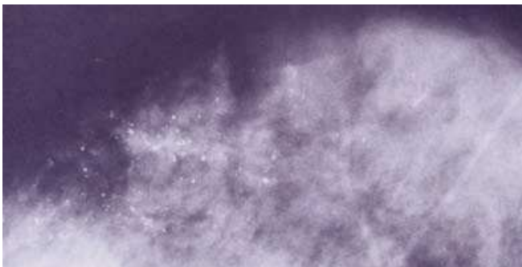
Fig. B: Microcalcificaciones en cuadrante superior de mama en relación con carcinoma.