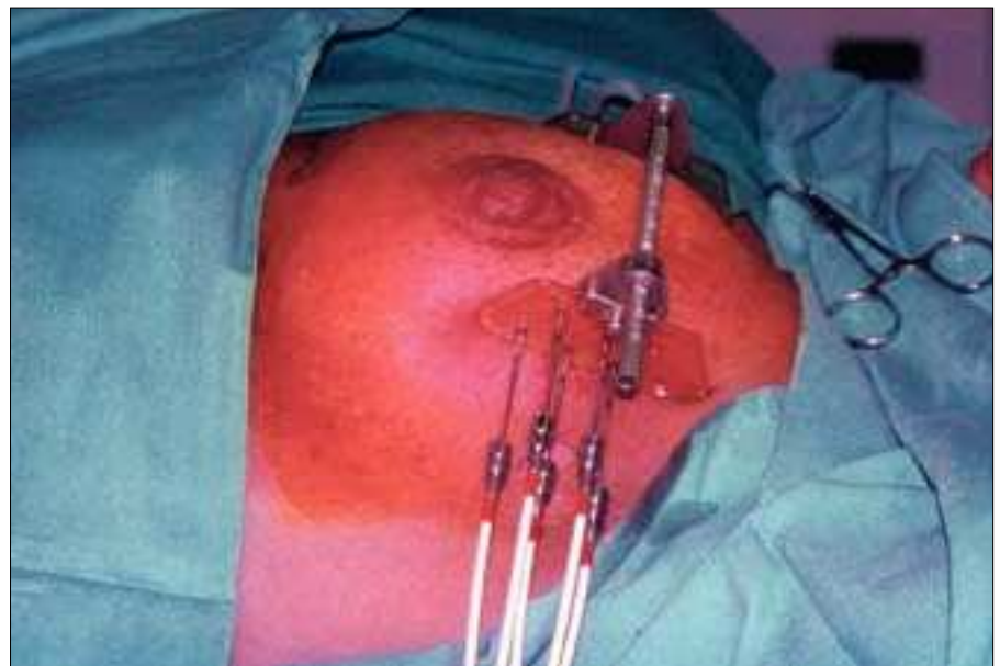
Fig. 1: Implante de braquiterapia de alta tasa de dosis.

Las pacientes con cáncer de mama van a desarrollar en un porcentaje elevado metástasis óseas, con dolor no controlado por analgésicos, compresión medular, riesgo de fractura por afectación vertebral o de huesos largos. En estas situaciones, pueden beneficiarse de tratamiento radioterápico en forma de tratamientos abreviados: 1 fracción de 600-800 cGy, 5 fracciones de 400 cGy, o 10 fracciones de 300 cGy que producirán alivio del dolor en aproximadamente un 60-70 % de las pacientes en un plazo de 2-4 semanas y con una duración del efecto de 3 a 12 meses. (19)