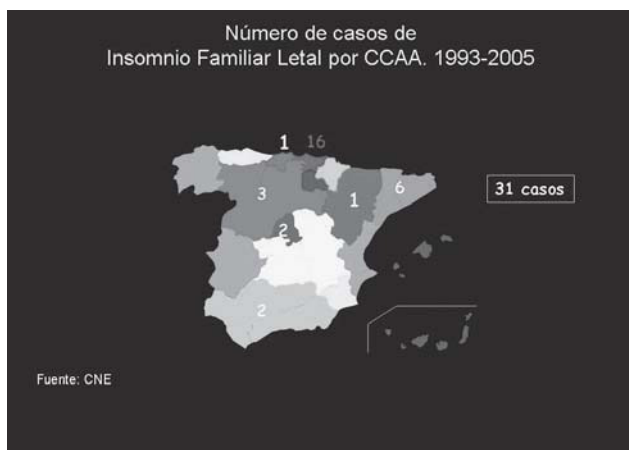
Figura 2: Alta incidencia en Euskadi del Insomnio Letal Familiar comparada con las demás comunidades autónomas españolas.

y de proteína 14-3-3 en el LCR y para la práctica de las autopsias con medidas de seguridad (BA). Además de las tinciones histológicas convencionales se ha practicado inmunohistoquímica para PrPres en la mayoría de los casos. En los últimos cinco años se han practicado también estudios en fresco en 32 pacientes mediante inmunotransferencia para identificar el isotipo de la PrPres con la técnica de Prionics WB y usando los anticuerpos monoclonales 6H4 y P4 (7) (RJ y JG). Los datos actualizados del registro se han presentado en las reuniones regulares de la Sociedad de Neurología del País Vasco para mantener un alto índice de sospecha entre los neurólogos sobre estas enfermedades.