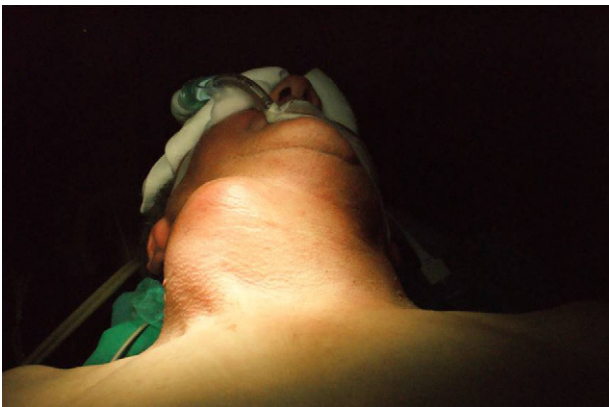
Figura 1 Imagen que muestra la masa laterocervical derecha.