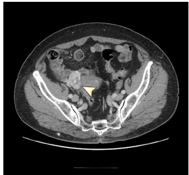
Figura 3 TC con contraste. Corte axial en el que se aprecia la misma lesión que en la imagen 2.

de la paciente se trate probablemente de un tumor ovárico virilizante. Resto de la TC: sin otros hallazgos patológicos.