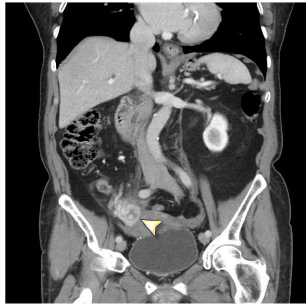
Figura 2 TC con contraste. Corte coronario en el que se aprecia una tumoración anexial de 2 x 3 cm, con realce heterogéneo y zona hipodensa central.