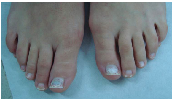
Figura 1 Lesión onicodistrófica blanquecina en ambos hallux , sin signos inflamatorios.

De las 2 muestras se realizaron cultivos en agar Sabouraud glucosado con la adición de cloranfenicol y en agar selectivo y diferencial para el desarrollo de dermatofitos (DTM). Se incubaron a 28 °C durante 15 días. Transcurridas 48 h, en agar Sabouraud se observaron colonias vellosas de color pardo negruzco en el anverso, con reverso pardo oscuro. A partir de estas se realizaron microcultivos en agar papa glucosado. En DTM no se observó desarrollo finalizados los