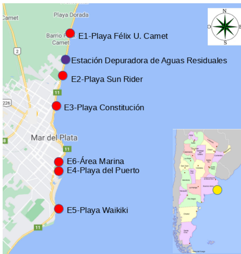
Figura 1 Sitios de muestreo a lo largo de la costa marplatense.

los bañistas. E1 y E2 están próximas a la Estación Depuradora de Aguas Residuales (EDAR, Obras Sanitarias Sociedad de Estado), E3 y E4 están vinculadas a descargas de efluentes pluviales (de mayores dimensiones en E3) y E5 no recibe descarga directa significativa de ningún tipo. Para evaluar el posible impacto de la navegación en un área de acceso prohibido para bañistas, también se muestreó la zona de aparcamiento de embarcaciones del puerto de la ciudad (E6, área Marinas) (fig. 1).