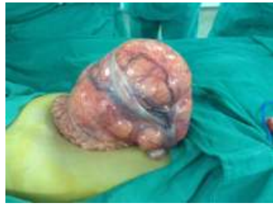
Figura 3 Lipoblastoma exteriorizado durante el acto quirúrgico.

La recuperación postoperatoria de la paciente fue satisfactoria, siendo dada de alta al cuarto día postoperatorio. En