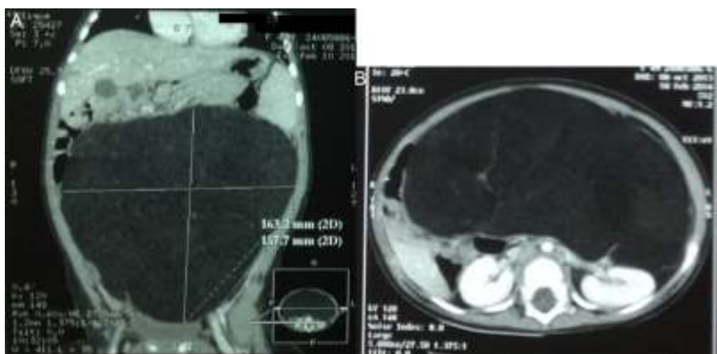
Figura 2 A y B. Escanograma y corte transversal de TC de abdomen que muestran imagen hipodensa, de aspecto lipodeico que abarca casi la totalidad de la cavidad abdominal.

En 1926 Jaffe acuñó por primera vez el término lipoblastoma para referirse a una lesión lipomatosa atípica compuesta de células similares a los adipocitos embrionarios (o lipoblastos), para poder diferenciarla del lipoma común que no posee dichas células 13 . En efecto, esta neoplasia posee una arquitectura lobulada por septos finos, y está compuesta de tejido mesenquimático y células adiposas en distintas etapas de diferenciación, entre las que destacan adipocitos maduros, lipoblastos típicos uni o multivacuolados y prelipoblastos, con una distribución externa del tejido menos diferenciado; y todo esto rodeado de una pseudocápsula fibromembranosa que puede ser circunscrita o difusa, razón por la que en 1973 Chung y Enzinger propusieron clasificarlos según su comportamiento en lipoblastoma propiamente tal, a la forma localizada, circunscrita y encapsulada (73%), y lipoblastomatosis a la presentación múltiple, infiltrativa y no capsulada (27%) 14,15 , con capacidad de infiltración local