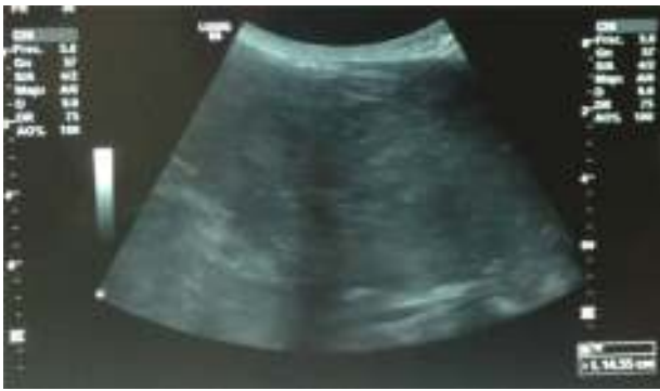
Figura 1 Ecografía abdominal con imagen de masa abdominal de aproximadamente 15 cm de diámetro, ecogénica levemente heterogénea y de bordes mal definidos.

Se planificó la resolución quirúrgica mediante laparotomía media infraumbilical, evidenciándose a nivel pélvico un tumor retroperitoneal bien delimitado, de 18 cm de diámetro, que rechazaba el uréter izquierdo, el anexo izquierdo y el colon sigmoides, sin infiltración de dichas estructuras (fig. 3). Se realizó exéresis completa del tumor con preservación de las estructuras mencionadas.