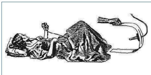
Figura 1. Perineómetro de Kegel.

Fue Arnold Kegel en los años 50, quien describe por primera vez los ejercicios del piso pelviano como tratamiento de la incontinencia urinaria, diseñando además un perineómetro para evaluarlos (4). Estos ejercicios, conocidos como ejercicios de Kegel, conforman la base histórica sobre la cual se desarrolla lo que hoy conocemos como reeducación pelvipérea (RPP) (Figura 1).