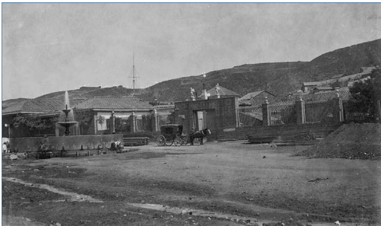
Figura 2. Hospital San Juan de Dios de Valparaíso. 1863.

ció en Mendoza el 3 de diciembre de 1810. Tiempo de levantamientos de las distintas naciones sudamericanas, Mendoza jugó un papel importante en la independencia de Argentina, pero también sufrió una larga serie de batallas entre las distintas facciones de los caudillos que luchaban por la independencia primero y por la manera de gobernarse a sí mismos después.