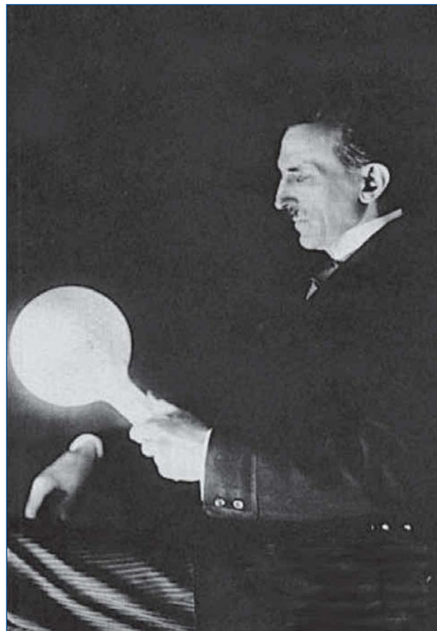
Figura 2. Tesla usa su propio cuerpo como conductor eléctrico de una ampollita.

En una oportunidad en su laboratorio en Manhattan, Nueva York, y debido a sus experimentos, provocó conscientemente una pseudo explosión. Su idea era remecer los edificios aledaños a la semejanza de un terremoto, pero con la precaución de no provocar daño (3).