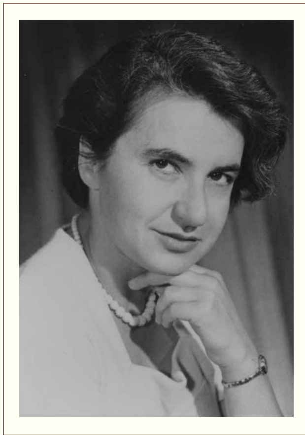
Figura 1. Rosalind Franklin.

A pesar de la oposición inicial de su padre para que ella siguiera estudios superiores, ingresa a Cambridge a los 18 años para estudiar química en el Newnham College. Cabe destacar que en ese momento histórico las restricciones de las mujeres para realizar estudios superiores eran grandes. De hecho en algunas universidades inglesas se restringía el número de matrículas de