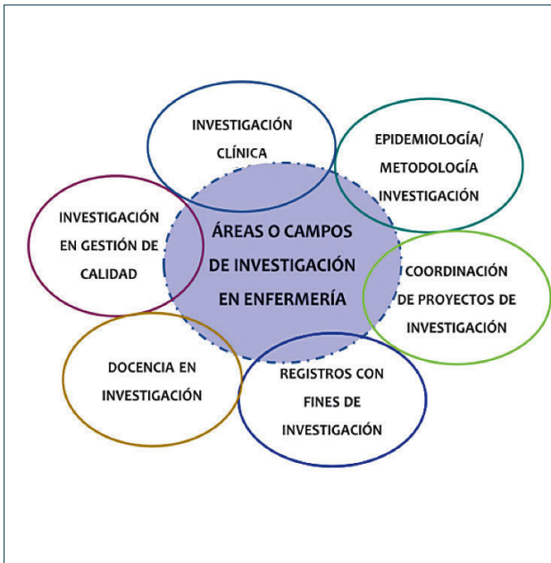
FIGURA 1. Áreas o campos de investigación en enfermería