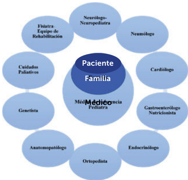
Esquema 2. Diagrama equipo multidisciplinario de diagnóstico y tratamiento de enfermos neuromusculares