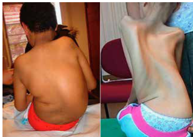
Figura 1. Escoliosis en AME tipo 2 (sin abordaje)

Otras patologías neuromusculares pueden desarrollar escoliosis como por ejemplo las distrofias musculares de cintura de miembros (LGMD) y las neuropatías sensitivo motoras hereditarias (HMSN) aun sin perder la capacidad de marcha. (Figura 1).