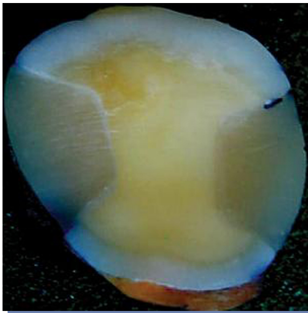
Figura 1. Muestra con corte transversal realizado.

Con un disco de carburundum en micromotor con abundante refrigeración con agua se realizaron cortes transversales a las coronas pasando por la parte media de las restauraciones indirectas de los dos grupos, de tal manera de poder medir el grado de microfiliación (Fig. 1). El corte se realizó de forma intermitente para disipar el calor producido.