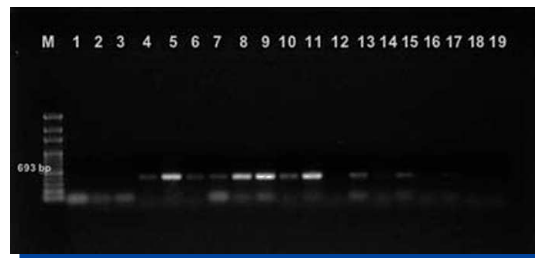
Figura 1. Identificación de P. gingivalis mediante PCR basada en la secuencia de inserción IS 1126.

Se identificaron molecularmente como P. gingivalis , a través de la técnica de PCR, a 35 aislados de bacterias pigmentadas de negro. En la Figura 1 se aprecia un gel de agarosa al 0,8%, en donde se observan los resultados de amplificación mediante PCR basada en la Secuencia de Inserción IS1126, utilizando los partidores PI1 y PI2. Se identificó como P. gingivalis a los aislados bacterianos en los que se visualizó la banda de 693 bp. La banda débil que se observa en el carril 17 se consideró positiva para la identificación de ese aislado como P.gingivalis .