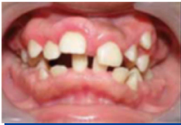
Figura 5. Control clínico donde se observó disminución en el volumen del tejido gingival, con exposición de las coronas dentarias.

encia, de forma generalizada, que puede llegar a cubrir las coronas de los dientes, generando alteraciones bucales como diastemas, dificultad en la masticación y retraso en la erupción dentaria (15,16) ; características clínicas similares a las reportadas en el presente caso donde se observó agrandamiento gingival generalizado en el maxilar y mandíbula, cubriendo la totalidad de la corona de los dientes anteriores y más del 85% en los dientes posteriores, originando discapacidad funcional como incompetencia labial, problemas en el proceso de la masticación, retraso en la erupción de los dientes permanentes y dentición temporal tardía.