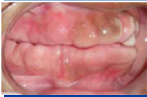
Figuras 1 y 2. Aumento en el volumen de la encía de forma generalizada, con apariencia fibromatosa, cubriendo la corona de los dientes.