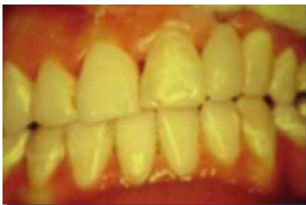
Figura 9. Finalización.