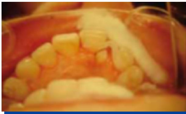
Figura 6. Inicio de la colocación del puente.