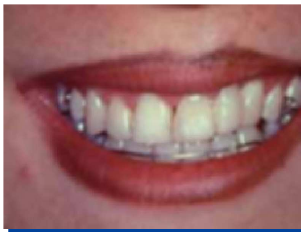
Figura 11. Puente pulido y terminado. Retiro de asa vestibular a la contención superior.