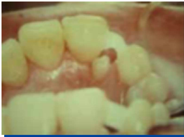
Figura 7. Ribbond® adherido.