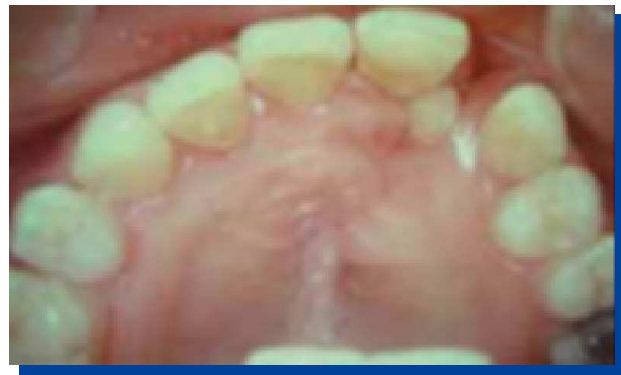
Figura 5. Zona de la fisura con la agenesia.

Se retiró la aislación relativa y se adaptó la zona gingival con resina compuesta para terminar el pónico. Posteriormente, se procedió a pulir la resina y se comprobó que la cinta no presentara zonas expuestas al medio bucal.