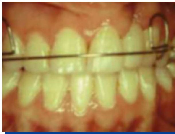
Figura 10. Con placa de contención.