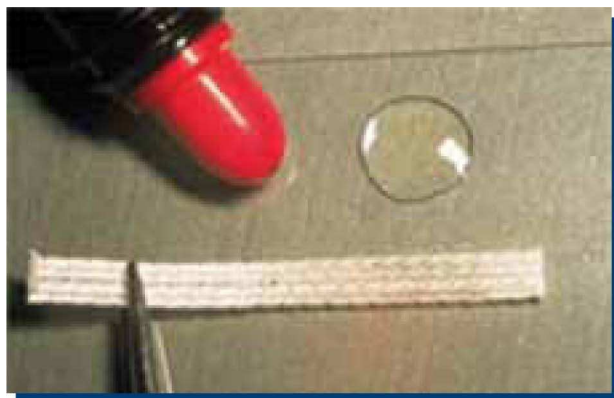
Figura 2. Cinta de Ribbond de 2 mm.

Estas fibras pueden ser cortadas usando una herramienta adecuada (tijera microdentada) sin dañarlas (1,7,8) .