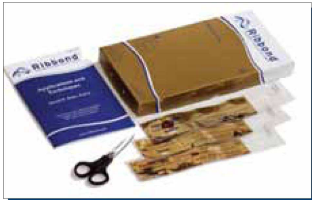
Figura 1. Set completo con tijera accesoria.

Ribbond® es una fibra hecha de polietileno de ultra alto peso molecular, que tiene sus inicios desde 1992 (2) . Es tratado con plasma de gas frío para aumentar la adhesión a los materiales sintéticos de restauración, la red de fibras especiales de este material permite un eficiente traspaso de fuerzas, es virtualmente plegable y debido a esto se adapta fácilmente a la morfología dentaria y al contorno del arco dentario.