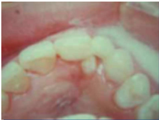
Figura 8. Tallado del diente.