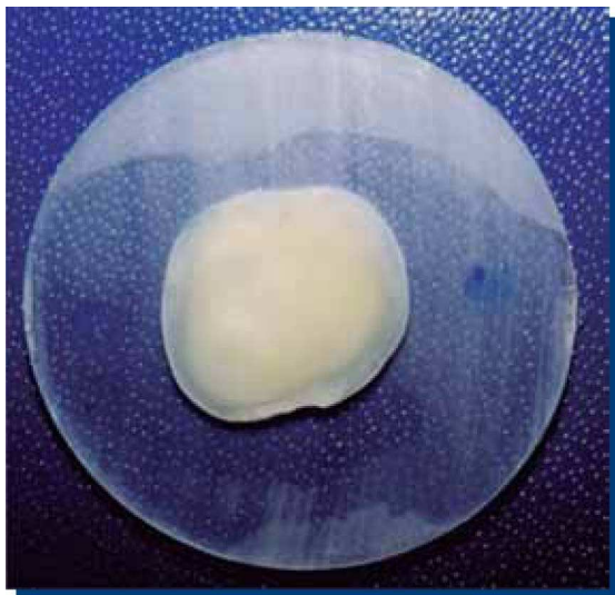
Figura 1. Muestra/Unidad de trabajo: Disco dentinario.