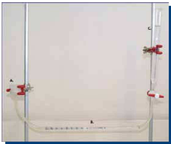
Figura 2. Máquina de difusión. A: Cámara de difusión; B: Capilar milimetrado; C: Columna de agua.