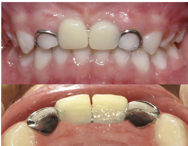
Figura 4 Vista frontal y palatina de prótesis tipo Denari insertada.

Antes de cementar la prótesis las 2 partes del aparato fueron amarradas con hilo dental para evitar riesgo de aspiración y/o deglución de la prótesis por parte de la niña. Los vástagos centrales fueron insertados en los tubos presentes en los pónicos, previa a la cementación de la prótesis e insertada por coincidencia de ejes de inserción en los pilares. El sistema tubo barra se encuentra aliviado para permitir las posibles variaciones en el momento de insertar la prótesis.