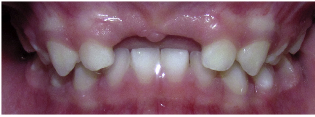
Figura 1 Examen clínico inicial.