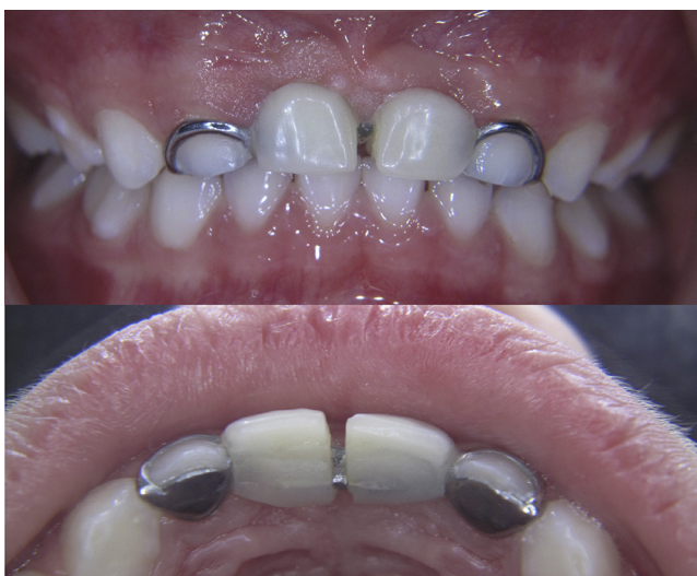
Figura 5 Control clínico a los 12 meses.

La figura 5 muestra una vista frontal y palatina de la prótesis a los 12 meses de seguimiento, donde se destaca un aumento del espacio interincisivo de aproximadamente 1,5 mm, lo que demuestra el crecimiento en sentido transversal. Es importante mencionar que la prótesis tiene fines estéticos, actúa de forma pasiva, por lo que no ejerce ninguna acción sobre los tejidos dentarios u óseos. Cualquier