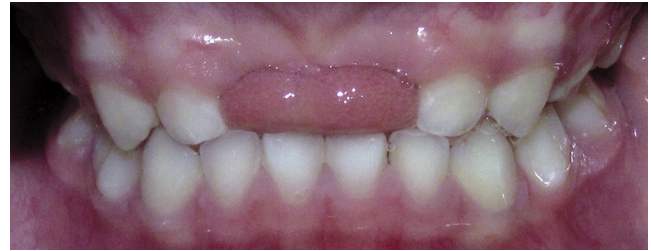
Figura 2 Interposición lingual.

dentoalveolar con resultado de avulsión de incisivos centrales superiores al caerse de una mesa en el jardín infantil al cual asiste, en febrero de 2011.