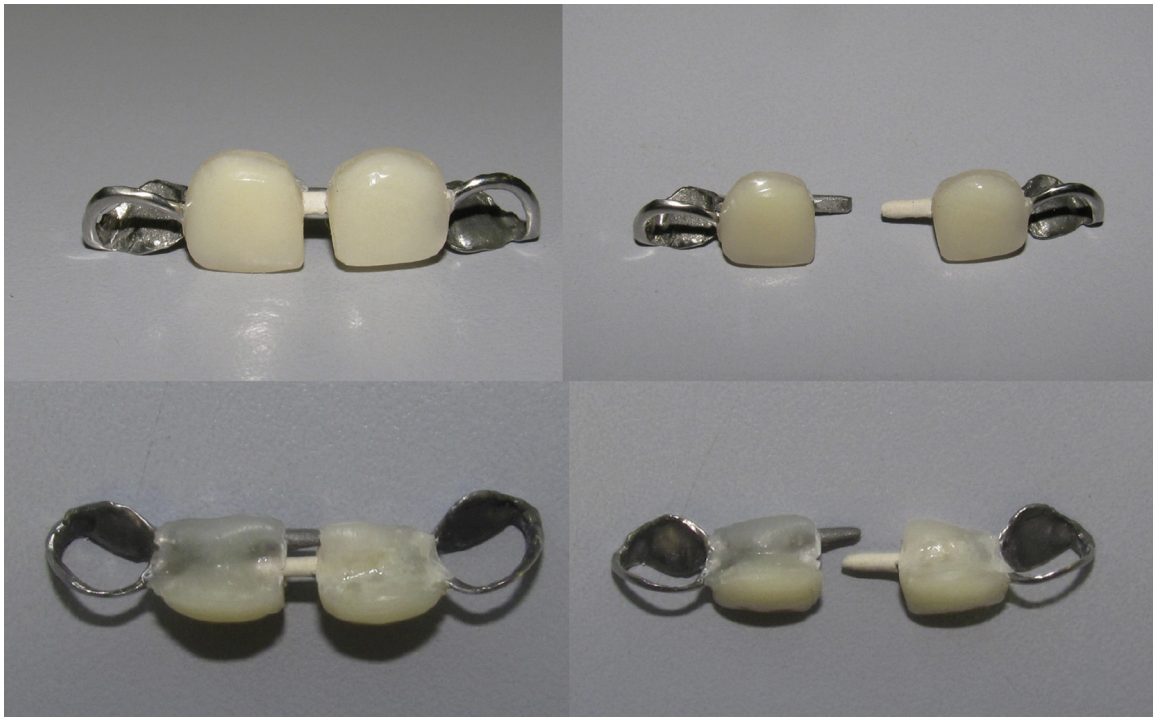
Figura 3 Prótesis tipo Denari.

Posteriormente se tomaron los modelos de las arcadas superior e inferior con alginato. El registro de mordida fue tomado con una lámina de cera. Se optó por no realizar ningún tipo de preparación en los dientes de apoyo de la futura prótesis. Durante el procedimiento la niña presentó un buen comportamiento gracias al manejo conductual realizado durante la fase preventiva.