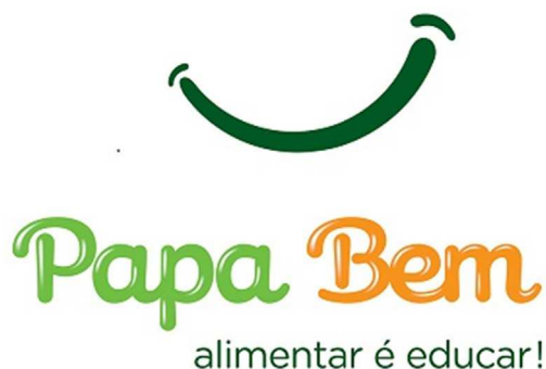
Figura 2 – Logotipo e slogan do projeto «Papa Bem».

Estas e outras opções estratégicas para a produção de materiais podem ser observadas nas tabelas 2, 3 e 4, relacionadas com os fatores predisponentes, facilitadores e de reforço associados à obesidade infantil encontrados no diagnóstico da área-piloto.