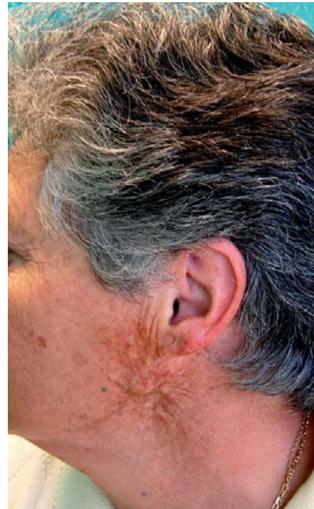
Figura 1 – Área de radiodermatitis en la cola de parótida izquierda.

El análisis hematológico y bioquímico de rutina, así como los resultados de radiología simple, fueron rigurosamente