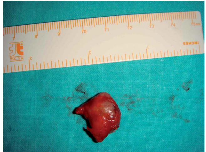
Figura 4 – Especimen quirúrgico de 2 × 1,5 cm de diámetro.

El tratamiento definitivo es el quirúrgico, con enucleación total de la lesión cuando el paciente contaba 2,5 meses de