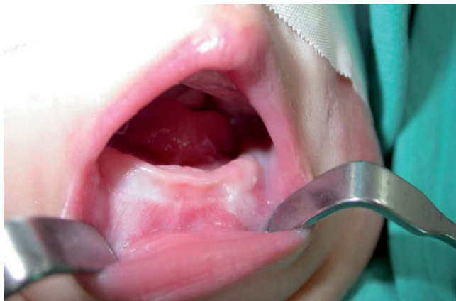
Figura 1 – Clínica intraoral preoperatoria del paciente. Tumor a nivel de suelo de boca que rechaza la lengua hacia la orofaringe, con dificultad para la deglución.

La exploración física muestra una masa de consistencia quística de unos 2,5 × 2 cm de diámetro, en línea media de suelo de boca. La lesión ocasiona macroglosia y anquiloglosia al paciente, sin obstrucción de la orofaringe pero con dificultad para la lactancia (fig. 1).