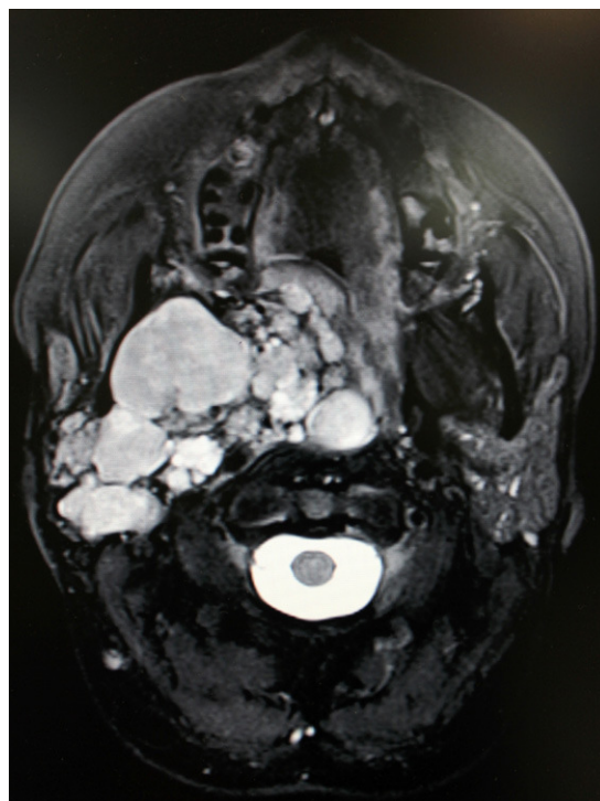
Figura 1 – RM preoperatoria (corte axial).

Se decide completar el estudio de extensión con una resonancia magnética (RM) (figs. 1 and 2) en la que se aprecia una gran lesión expansiva tumoral polilobulada localizada en el espacio parafaríngeo derecho, que se extiende al espacio masticador y oro-nasofaríngeo del mismo lado, condicionando un desplazamiento anterior de las superficies mucosas faríngeas con obliteración de las coanas y estenotando la luz faríngea. Se aprecia una desviación de la arteria carótida interna que se encuentra englobada por la tumoración y además una