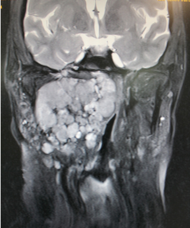
Figura 2 – RM preoperatoria (corte coronal).

obliteración de la vena yugular interna. En su sector anterior también desplaza la luz lingual. La tumoración presenta un tamaño aproximadamente 6,5 cm * 6,8 cm * 4 cm en sus ejes transversal, cráneo-caudal y antero-posterior respectivamente y presenta una señal marcadamente heterogénea. Se observan múltiples ganglios linfáticos laterocervicales bilaterales que no reúnen criterios radiológicos de malignidad.