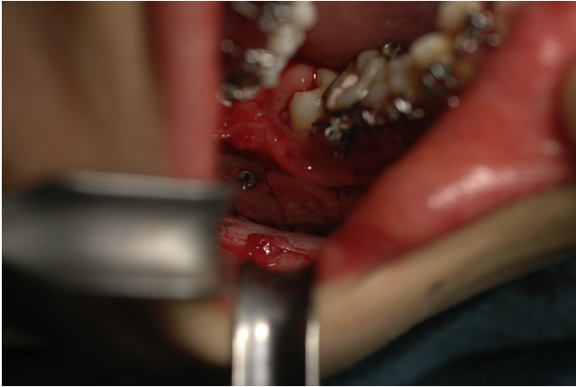
Figura 4 – El defecto monocortical es reconstruido.

espacio muerto entre el borde caudal y lateral confinando el defecto óseo a cubrir. Se aplica el cemento en fase licuada y se hace una ligera presión sobre la mejilla de forma continua durante unos 5 min procediendo después a la retirada de la lámina.