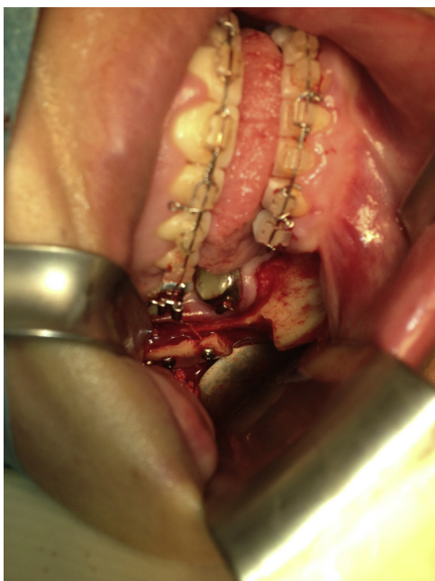
Figura 1 – Doble defecto monocortical: defecto en el avance e injerto tomado del borde inferior.

Requiere cierta experiencia saber cuándo el cemento ha alcanzado la consistencia óptima. Cuando el material ha alcanzado una consistencia de masilla, entonces es demasiado tarde para su aplicación (fig. 2).