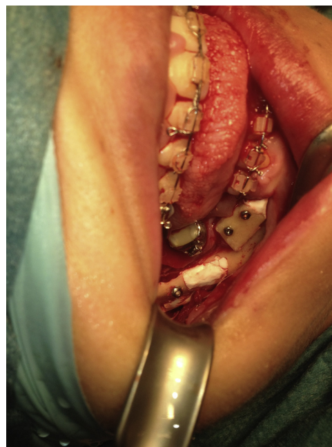
Figura 2 – Reconstrucción de los defectos mostrados en la figura 1, aumento del proceso alveolar con el injerto obtenido del borde inferior.