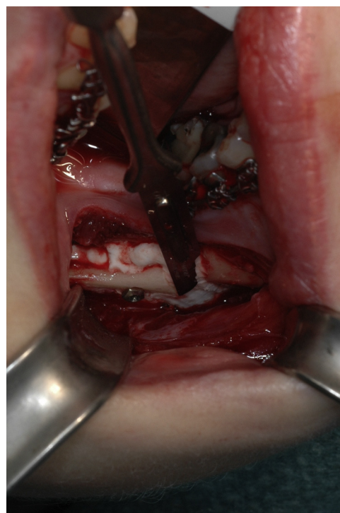
Figura 3 – Afeitado del exceso de Hydroset mediante bisturí n.º 15.

El autor principal ha intentado usar, a modo de barrera de contención, una lámina fina, por ejemplo, un fragmento de guante estéril que se coloca por debajo del periostio y la mucosa yugal. El ayudante fija la lámina al borde inferior realizando presión desde la cara lingual mientras se crea un