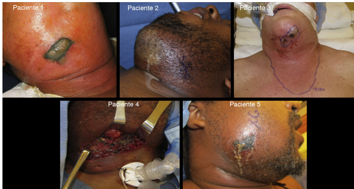
Figura 1 - Características clínicas iniciales en nuestros pacientes con FNC.