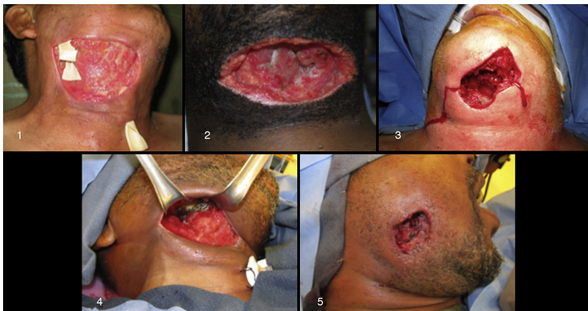
Figura 3 – Diferentes defectos después del desbridamiento agresivo.