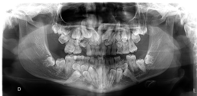
Figura 1 – Ortopantomografía.

http://dx.doi.org/10.1016/j.maxilo.2015.03.003