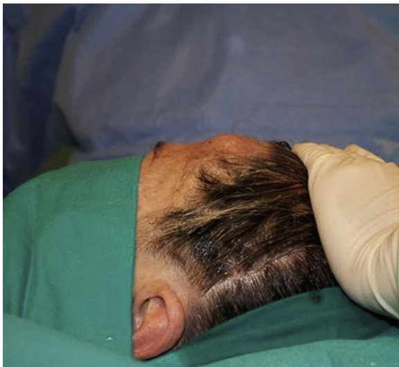
Figura 1 – Fotografía de perfil preoperatoria.

A la exploración presentaba aumento de volumen a nivel frontal izquierdo, de unos 2 cm de diámetro, indurado, asintomático, piel con características normales (fig. 1).