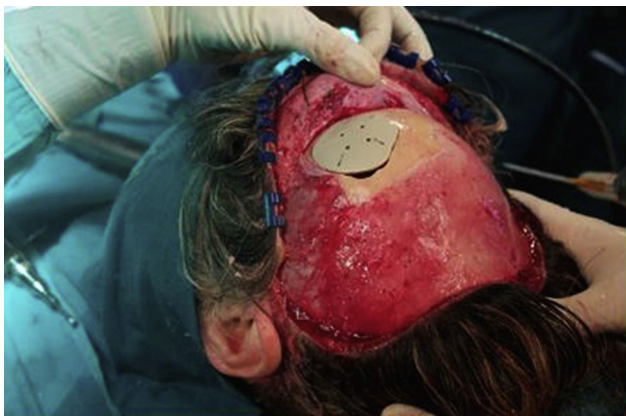
Figura 2 – Colocación de prótesis PEEK a medida del defecto.

El tratamiento de elección es quirúrgico, especialmente en aquellos casos en los que los síntomas no remiten 8 . Se debe de realizar una resección en bloque, con margen suficiente, y reconstrucción inmediata. El hecho de reseca la lesión con margen suficiente permite por un lado extirpar completamente la lesión y, además, reducir el riesgo de sangrado intraoperatorio 9 . En cuanto a la reconstrucción, aunque nosotros hayamos optado por una prótesis PEEK, en la literatura está descrito la reconstrucción con malla de titanio, bloques de hidroxapatita, injertos de hueso