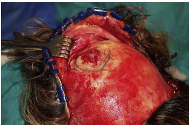
Figura 1 – Abordaje bicoronal con exposición del hemangioma.

vasculares en su interior. El tipo capilar muestra una pequeña red vascular rellena con eritrocitos y ausencia de tejido fibroso.