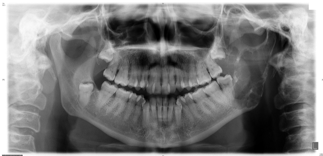
Figura 1 – Imagen osteolítica mandibular que hizo sospechar el diagnóstico.