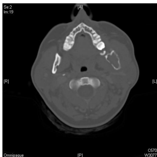
Figura 2 – Se observa el alcance de la lesión osteolítica en rama mandibular izquierda.

mandibular. Hemos utilizado los términos «multiple myeloma mandible» NOT «bisphosphonate» para descartar artículos que se centraran en la osteonecrosis por bifosfonatos indicados a raíz de un mieloma; «multiple myeloma primary lesion jaw»; «multiple myeloma primary manifestation mandible» y «multiple myeloma mandibular lesion».