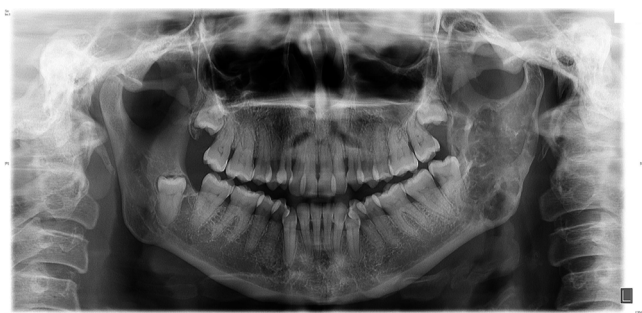
Figura 3 – Osificación parcial de la lesión osteolítica en rama mandibular tras el tratamiento de quimio y radioterapia.

Hemos descartado aquellos artículos en los que la lesión mandibular no se presentaba al diagnóstico y para los que el abstract no era accesible en inglés.