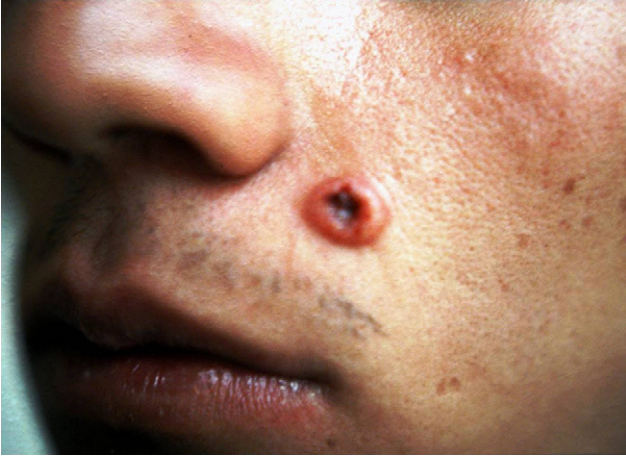
Figura 1. Lesión cutánea del labio superior en forma de tubérculo ulcerado cubierto por una costra.