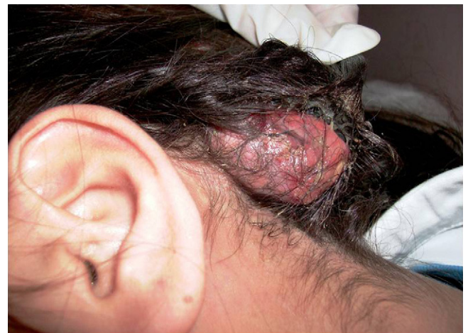
Figura 1. Lesión nodular de cuero cabelludo, con áreas de supuración y ulceradas.

Eritrosedimentación 52 mm en la primera hora, hematíes 4,7 \times 10^6/\mu\text{l} , hematocrito 37,5%, hemoglobina 12,7 g/dl, leucocitos 7.900/ \mu\text{l} , neutrófilos 71%, eosinófilos 2%, basófilos 0%, linfocitos 21%, monocitos 6%, plaquetas 220.000/ \mu\text{l} , uremia 20 mg/dl, creatininemia 0,80 mg/dl, glucemia 88 mg/dl, uricemia 4,5 mg/dl,