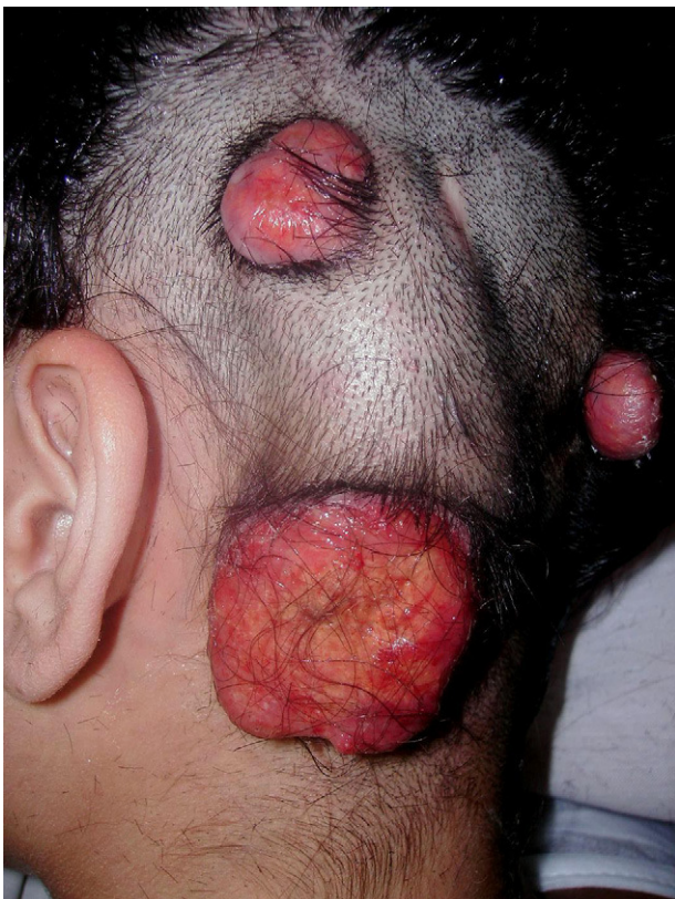
Figura 2. Lesiones nodulares del cuero cabelludo antes de la extirpación quirúrgica del nódulo mayor.