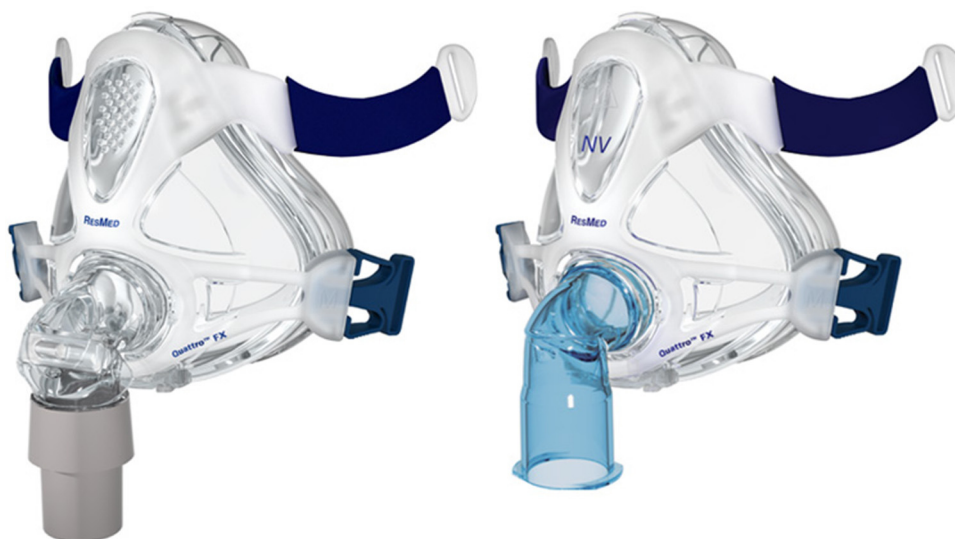
Figura 2 Mascarillas con puerto y sin puerto espiratorio. Mascarilla vented , con puerto respiratorio (codo blanco) para uso en respiradores específicos de VNI y mascarilla non-vented , sin puerto espiratorio (codo azul) para uso en respiradores de UCI. El color de esta figura solo puede apreciarse en la versión electrónica del artículo.

no está siendo segura ni efectiva y no demorar el momento de la intubación traqueal y ventilación mecánica invasiva 19 porque tal y como mostraron Esteban et al. 20 este retraso puede ser causa de la alta mortalidad que se da en pacientes en los que la VNI fracasa.