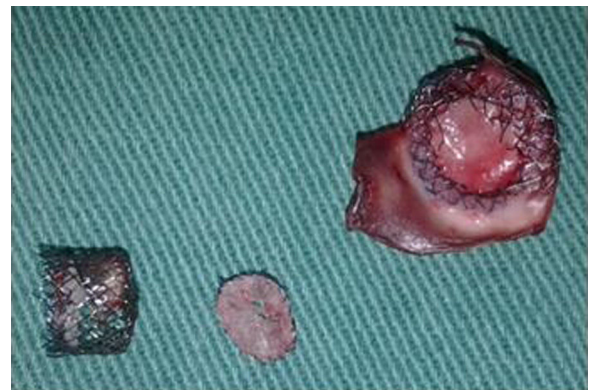
Figura 3. Segmento aórtico y Amplatzer® extraídos.