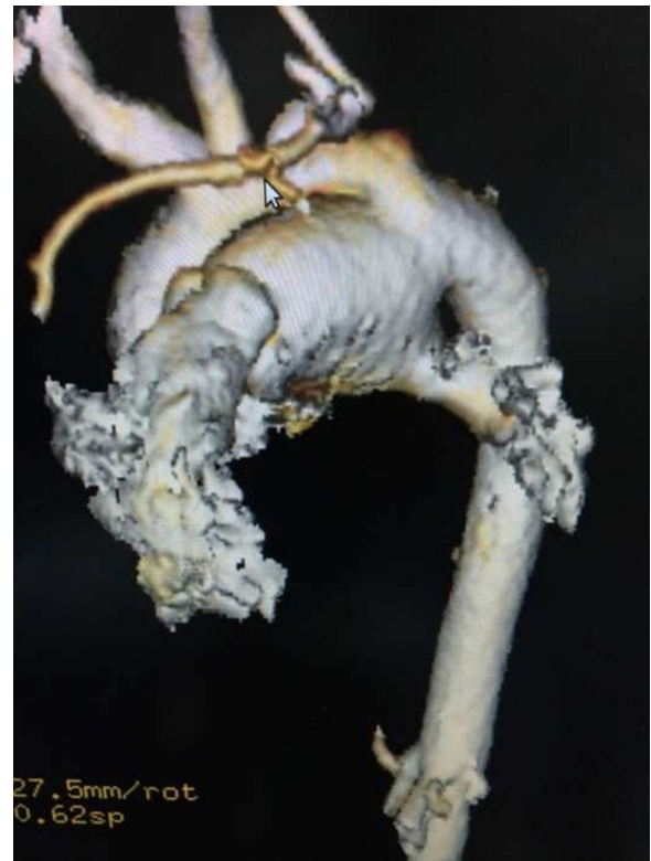
Figura 2. Tomografía computarizada de tórax.

El estudio hemodinámico evidencia la presencia de un defecto CAP tipo ventana, con visualización de las ramas pulmonares y dilatación de la rama izquierda. Se descarta la presencia de conductos colaterales aortopulmonares. Estos hallazgos se confirman mediante angio-TAC de tórax (fig. 2).