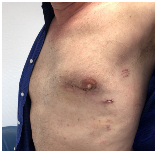
Figura 3. Heridas quirúrgicas a los 10 días de la cirugía.

En un esfuerzo por minimizar el acceso en cirugía cardíaca, los abordajes endoscópicos se van extendiendo en nuestra especialidad cada día más. Las ventajas potenciales de las técnicas menos