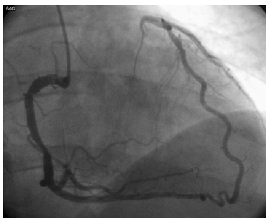
Figura 4. Oclusión de tercio proximal de arteria descendente anterior visualizada a través de coronaria derecha.

invasivas como son la reducción del trauma quirúrgico, mejores resultados cosméticos, menor dolor postoperatorio y, sobre todo, tiempos de recuperación funcional más cortos han sido ya demostrados en diferentes artículos 1-3 .