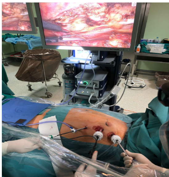
Figura 1. Visión de campo quirúrgico en 3D mediante cámara endoscópica. Colocación de trócares y disección endoscópica de la arteria mamaria.