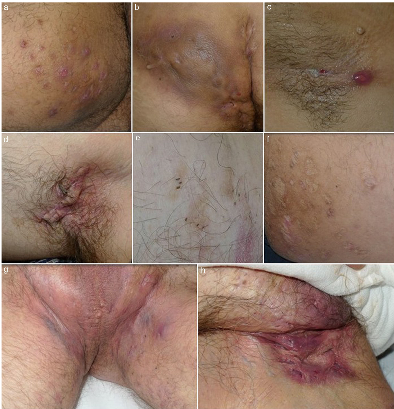
Figura 1 Imágenes clínicas de la hidrosadenitis supurativa. a) Nódulos inflamatorios localizados en la cara interna del muslo derecho. b) Gran absceso y fístula crónica que ocupa la nalga derecha. Destaca la hiperpigmentación de la nalga afectada. c) Fístula lineal en fase inicial. Se aprecia un nódulo inflamatorio y un sinus drenante localizado en la axila de una mujer de 22 años. d) Cicatriz en puente en axila izquierda. e) Dobles y triples comedones. f) Cicatrices atróficas tipo «boxcar». g) Hidrosadenitis de predominio folicular con presencia en el área inguinogenital de numerosos quistes, nódulos inflamatorios y abscesos. Llama la atención el eritema y edema que envuelve toda el área afectada. h) Cicatrices y fístulas drenantes en ingle derecha.

las ingles, b) objetivar la presencia de alguna de las lesiones consideradas típicas, incluyendo nódulos dolorosos o abscesos o sinus supurativos o cicatrices y c) que el curso de la enfermedad presente múltiples recurrencias 12 . En la mayoría de los casos, salvo sospecha de complicación o dudas diagnósticas, no realizaremos tomas de biopsias ni tomas de cultivo.