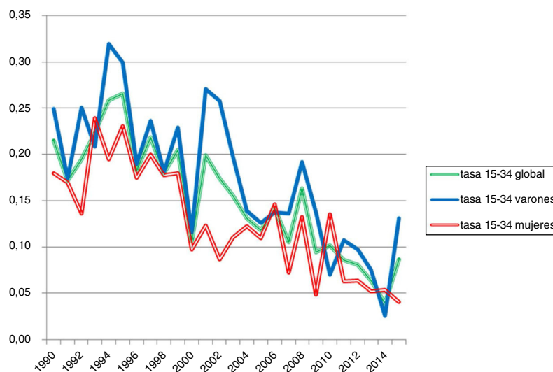
Figura 3 Tasas de mortalidad por asma entre 15-34 años en España: 1990-2015.

El asma es más prevalente en los niños, con un desplazamiento de género a partir de la pubertad. Los estudios sobre asma grave identifican también a las mujeres como grupo de riesgo (ratio mujer/hombre 4,4) junto con la obesidad 45 . Aunque el efecto de las hormonas no está completamente establecido por la presencia de factores de confusión como la obesidad, atopia o exposiciones ambientales, entre otras,