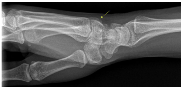
Figura 1 Radiografía convencional lateral de muñeca, con prominencia ósea en la base del 3.º metacarpiano (flecha).

La prominencia ósea «carpal boss» puede representar la presencia de un centro de osificación accesorio ( os styloideum ) que aparece durante el desarrollo embrionario, o bien la