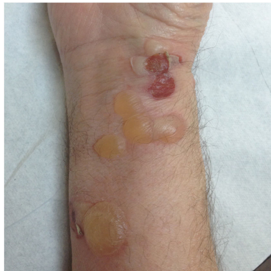
Figura 1 Penfigoide ampollosa: ampollas tensas de contenido seroso sobre base urticariforme.