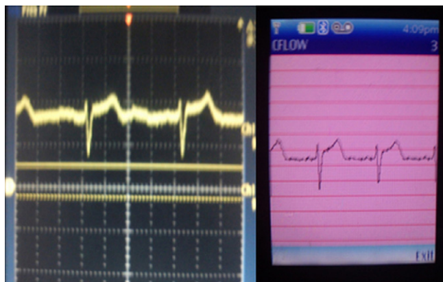
Figura 2 En el lado izquierdo de la figura se observa la señal del ECG, en un osciloscopio colocando los electrodos en DI, de lado derecho se observa la misma señal pero ahora en la pantalla del móvil.

En la figura 2 se muestra la pantalla del osciloscopio donde se observa el trazo de un ECG en su derivación DI,