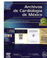
IMAGEN EN CARDIOLOGÍA