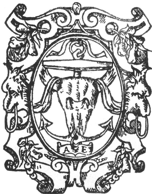
Figura 1 Primera marca tipográfica en la Nueva España por Antonio de Espinosa (1566).

Otra serie de viñetas se refiere a las marcas tipográficas de impresores antiguos desde Giovanni Angelo Scinzezeler (Milán, 1505) a Paolo Manuzio (Venecia, 1555), los hermanos Froben de Basilea (primera mitad del siglo xvi) y Michael Sonnino (París, 1580). Entre estas viñetas figura la primera marca tipográfica (fig. 1) introducida en la Nueva España por el español Antonio de Espinosa, antiguo colaborador del impresor italiano Juan Pablos (Giovanni Paoli), en 1566. Asimismo está la marca tipográfica de Ludwing Elzevirius o Elzevier (Leiden, 1595) (fig. 2), uno de los fundadores de la Casa Elzevier, todavía activa y próspera en nuestros días. Parece justo mencionar asimismo el colofón de la Rethorica Christiana del tlaxcalteca fray Diego Valadés OFM, primer libro de un autor americano impreso en Europa, específicamente en la ciudad italiana de Perusa, el año 1579.